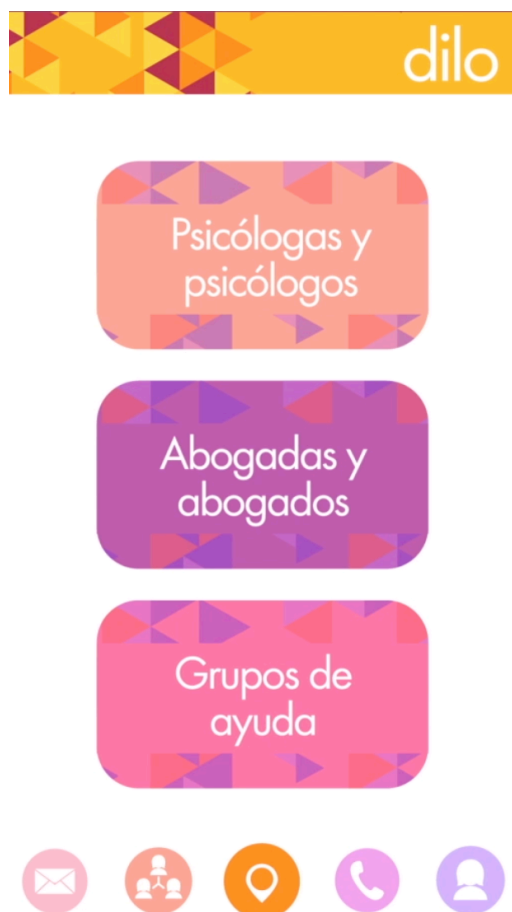
Figura 3. Contactos